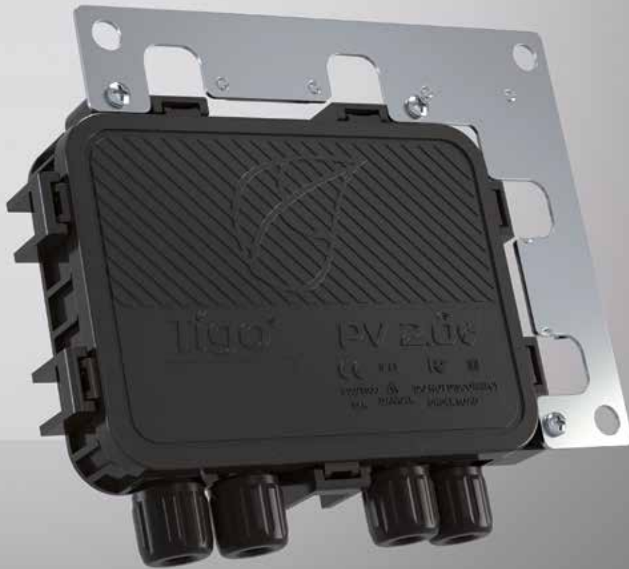
TS4-R OPTIMALISATIE COMPATIBEL MET OMVORMERS VAN BEKENDE FABRIKANTEN.